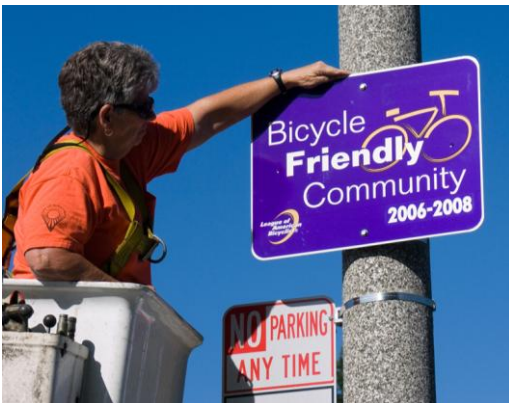
Sunnyvale has been designated as a bicycle friendly community by the League of American Bicyclists.

Maecenas pretium metus vel metus consequat eleifend. Phasellus aliquet vestibulum risus non venenatis. Maecenas vel lorem diam. Maecenas vel risus ante, sit amet mollis velit. Integer quis sem elit, eget adipiscing lectus. Curabitur tincidunt nibh et neque venenatis ultricies. Sed malesuada feugiat turpis, eget aliquet justo varius sed. Nam hendrerit aliquam nulla, vestibulum faucibus tellus venenatis ut. Sed nisl risus, mattis a molestie ut, porttitor sed tortor. Suspendisse a augue eget ante varius aliquam a quis ipsum. Nunc ante nunc, consequat vel lobortis sit amet, posuere a metus. Sed sollicitudin porttitor arcu id dignissim. Vestibulum blandit dapibus egestas. Cras eget lectus orci. Proin tincidunt justo sagittis enim cursus ut faucibus metus rutrum.